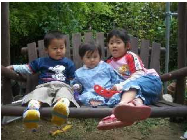
私が野球観戦に行っている間に妻と私の父が組み立てた木製ブランコ。