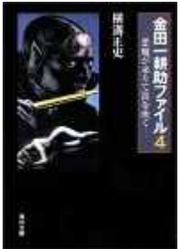
悪魔が来りて笛を吹く