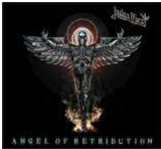
Angel of Retribution

-「エンジェル・オブ・レトリビューション」ジューダス・プリースト これは以前、記事にしました。 「これぞ、ヘヴィメタル」というアルバムです。